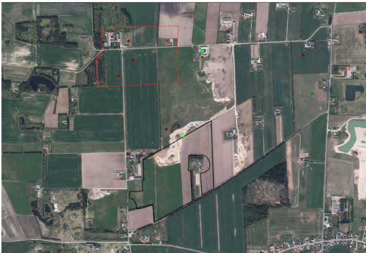
Planområdet med kendte fortidsminder i nærområdet.

På ovenstående kulturhistoriske baggrund er det Nordjyllands Historiske Museums vurdering, at der er en stor sandsynlighed for at påtræffe fortidsminder under terrænen ved råstofindvindingen. Jeg skal oplyse om at en større, arkæologisk forundersøgelse anbefales før anlægsarbejdet for at få af- eller bekræftet tilstedeværelsen af fortidsminder inden for det pågældende område.