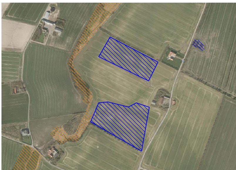
Figur 1 Indvindingsområde (blå skraver) og nærliggende § 3-arealer

Vest for indvindingsområdet løber Gundtoft Å, der er et beskyttet vandløb efter naturbeskyttelsesloven. En række overdrevsområder (§3) ligger i umiddelbar tilknytning til vandløbet. Umiddelbart syd for indvindingsområdet løber et vandløb med afledning til Gundtoft Å. Derudover ligger der en §3-beskyttet sø ca. 160 m nordøst for arealet. Placering af § 3-områder i forhold til indvindingsområde fremgår af nedenstående kortudsnit. Idet der ikke graves direkte op af vandløb, og idet der ikke graves under grundvandsspejl, vurderes det, at indvindingen ikke vil give anledning til direkte påvirkning af natur eller vandløb omfattet af § 3. Det skal under arbejdet sikres, at der ikke sker afledning af partikler eller sediment med overfladevand til vandløbet. Ligeledes skal det gennem afstandskrav sikres, at der ikke sker udskridning af jord til § 3-overdrev.