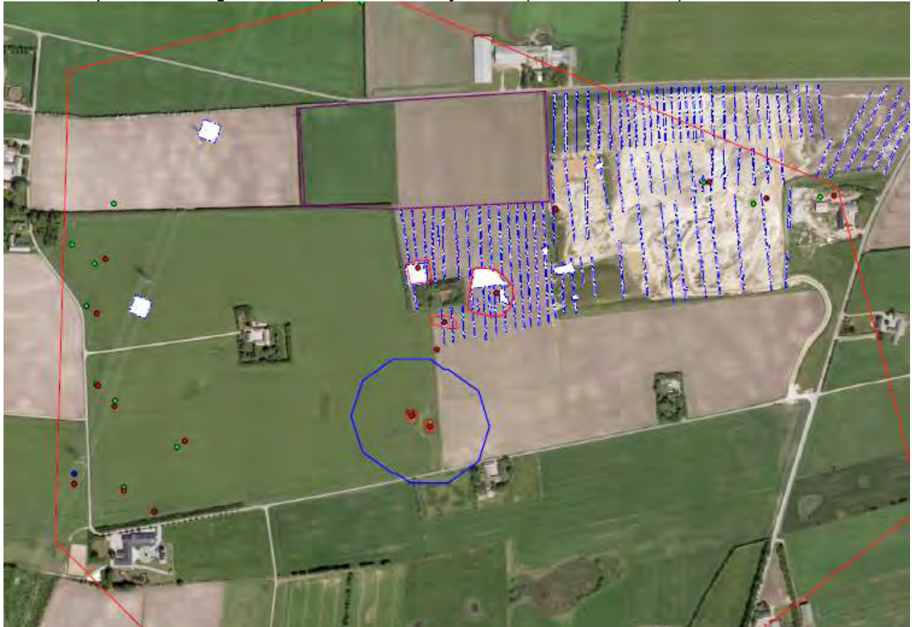
Planområdet med kendte fortidsminder i nærområdet.

Nordjyllands Historiske Museum skal hermed gøre opmærksom på, at museet kan have arkæologiske interesser i det pågældende planområde. Denne vurdering er baseret på at området er beliggende indenfor et kulturhistorisk areal hvor der er registreret marksystemer fra jernalderen (sb.nr. 120313-173) samt flere gravhøje og bopladsregistreringer. Museet har forundersøgt de tidligere etaper af grusgraven og ved den seneste etape blev der udgravet en boplads fra ældre jernalder (sb.nr. 120513-188)