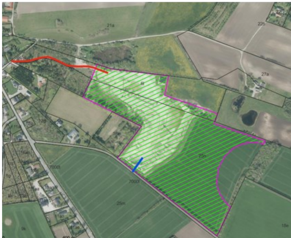
Figur 1: Den grønne/pink skravering viser det ansøgte areal. Den røde linje viser den nuværende adgangsvej til råstofgraven, den blå linje viser den omtrentlige placering af den nye adgangsvej til råstofgraven via Hedemarken.

Projektets behov for råstoffer – type og mængde i anlægs- og driftsfasen