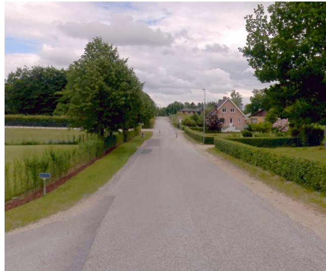
Figur 3 Døstrupvej mod syd