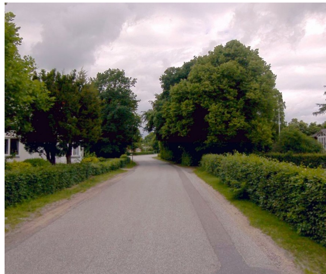
Figur 4 Døstrupvej mod nord

Som følge heraf vil samtlige transporter til og fra råstofgraven passere gennem Døstrup by via Døstrupvej, inden de fortsætter ud på det øvrige vejnet. Region