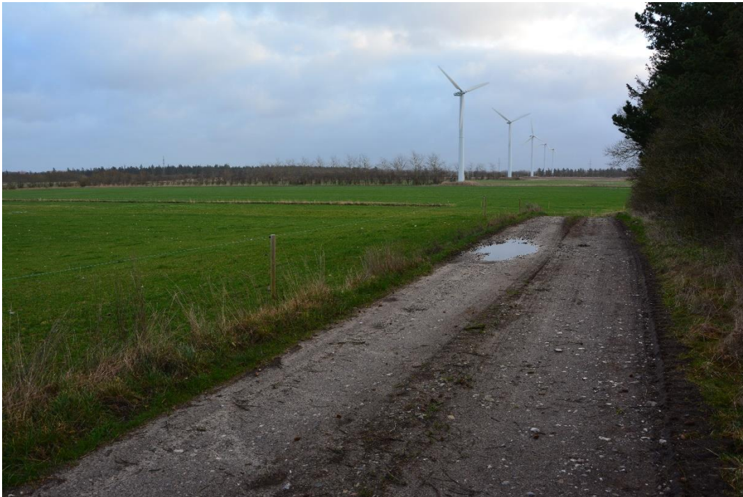
Markvejen og det efterbehandlede areal på matr.nr. 11a

Nedenfor ses det efterbehandlede areal på matr.nr. 11a, og arealet på matr.nr. 12a vil blive efterbehandlet på lignende vis. Regionen har endnu ikke godkendt efterbehandlingen.