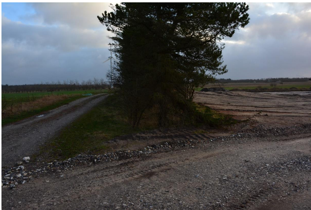
Læbæltet i skel mellem de to matrikler