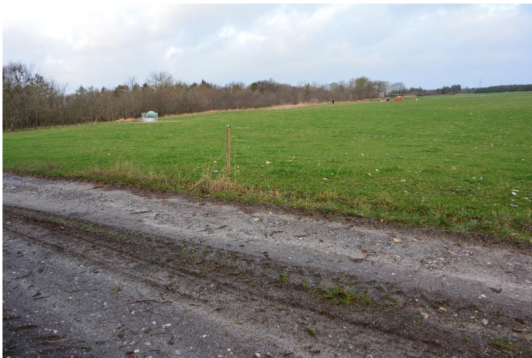
Markvejen og det efterbehandlede areal på matr.nr. 11a