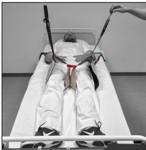
Samling af benstropper. Del 2 af 2